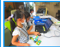
ロボットをレゴブロックで制作して動きをプログラムします